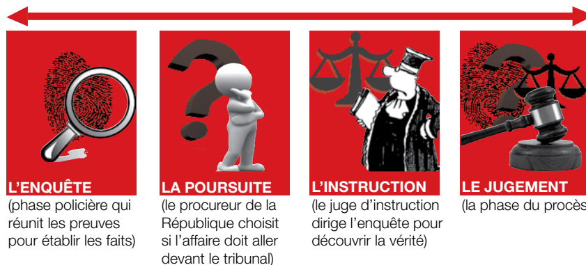
Schéma de la procédure pénale :

• La procédure pénale est l'ensemble des règles organisant le traitement des infractions, de l'arrestation (placement en garde à vue) jusqu'à la condamnation éventuelle ainsi que tout au long de l'exécution de la peine. La procédure pénale doit être scrupuleusement respectée pour garantir la validité du procès. Le procès pénal est le moment où le ou les juges vont statuer sur la culpabilité de l'accusé ainsi que sur la peine à appliquer en cas de condamnation. À l'issue du procès, le condamné ou le procureur de la République peuvent faire appel de la décision rendue. Dans ce cas, l'affaire sera rejugée par un tribunal et des juges différents. Après l'appel et seulement dans le cas où une règle de procédure ou de droit pénal n'a pas été respecté, le condamné ou le procureur de la République peuvent saisir la Cour de cassation pour casser, c'est-à-dire annuler le jugement. Si la cassation est obtenue, l'affaire sera à nouveau jugée par un tribunal pénal.