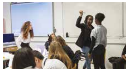
Adaptation de la pièce Douze hommes en colère par des lycéens montreuillois.

Au-delà des projets lancés chaque année, ECPM encourage également les initiatives ad hoc portées par chaque classe ou établissement pour s'engager sur l'abolition de la peine de mort. Ainsi, ECPM a déjà pu valoriser et/ou participer à divers projets créés et menés directement par des jeunes et leurs formateurs: blog, correspondance avec un condamné, représentation théâtrale, visites culturelles, expositions, projections.