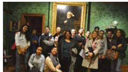
Visite de la maison de Victor Hugo par des collégiens de Colombes.