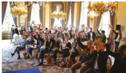
Cérémonie de remise des prix au Quai d'Orsay

Pour valoriser l'engagement citoyen des jeunes, ECPM organise régulièrement, à l'issue des concours annuels, une cérémonie de remise des prix dans un lieu prestigieux (ministère, mairie, barreaux, Assemblée nationale,...) et diffuse l'ensemble des productions des jeunes en France et à l'international, notamment lors des Congrès régionaux et mondiaux contre la peine de mort.