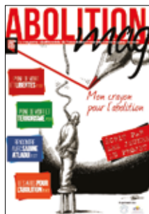
Magazine créé par les jeunes participants au projet d'initiation au journalisme (2015).

ECPM organise chaque année des projets à destination des jeunes, leur permettant de faire appel à leur créativité pour encourager leur engagement citoyen sur la thématique de l'abolition universelle de la peine de mort. Grâce à ces projets créatifs, les jeunes réalisent leurs propres outils de sensibilisation.