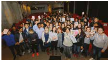
Cérémonie de remise des prix à la Mairie de Paris