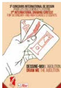
Catalogue des affiches gagnantes du concours « Dessine-moi l'abolition » (2012 / 2014 / 2016). (téléchargeables sur www.ecpm.org )